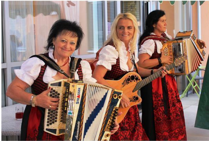
Die Sulmtaler Dirndl

Einladung zum Sommerfest am Sa, 23.06. um 11.30 Uhr