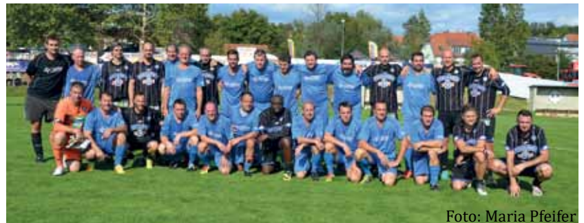
Fußball-Match mit den Legenden von Sturm Graz und Sinabelkirchen