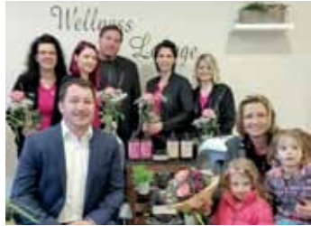
Umzug Michi's Hairstyle ins Hörmann-Center