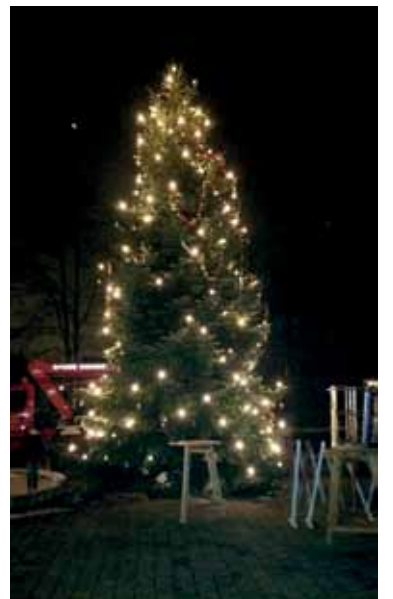
Eröffnung des Sinabelkirchner Advents