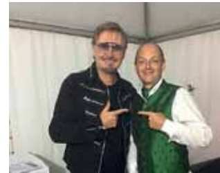
Nik. P Open-Air in der Siniwelt