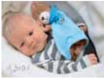
Gimpl Tobias, Unterrettenbach