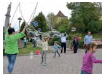
Marktfest 2017