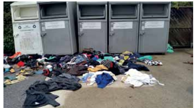
So wurden die Kleidercontainer der dezentralen Müllsammlung in Sinabelkirchen im September 2017 vorgefunden!

Nach der Entleerung werden die Textilien an Sortierbetriebe geliefert und in bis zu 70 Fraktionen (Farbe, Größe, Damen-, Herren-, Kinderbekleidung, Schuhe, Winter- und Sommerbekleidung) getrennt. Die Top-Ware wird in inländischen Second-Hand-Läden verkauft. Die restliche Ware geht nach Osteuropa und in den außereuropäischen Raum.