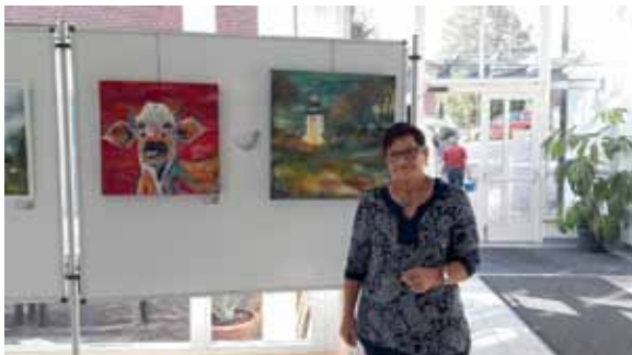
Ausstellung der Malgruppe Kramer im Amtshaus

Viele Fotos vom Marktfest finden Sie in der Fotogalerie der Homepage der Marktgemeinde Sinabelkirchen: www.sinabelkirchen.eu/fotos-2017