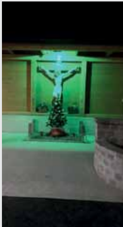
Das grüne Licht erhellt den Dorfplatz Untergroßau im Rahmen des stillen Advents im Vulkanland.

Wie Sie wahrscheinlich wis- sen, wohne ich in Unter- großau. Der Dorfplatz Unter- großau bereitet mir daher wie allen anderen in Untergroßau große Freude. Nachdem un- ser Dorfplatz fertig errichtet und eingeweiht wurde, trafen wir uns schon sehr oft, um an diesem besonderen Platz Gemeinschaft zu erleben. Derzeit begehen wir den Advent am Dorfplatz Unter- großau. Es ist schön zu sehen, wie unser neu geschaffener Platz nun fester Bestandteil im Jahreslauf der Bewohne- rinnen und Bewohner wird.