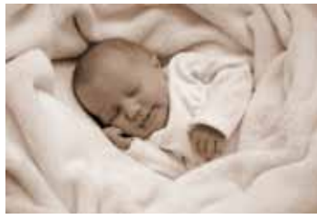
Ella Platzer, Sinabelkirchen