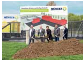
Erweiterung Betriebsstandort Münzer Bioindustrie