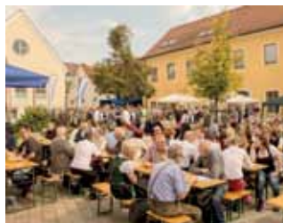
Marktfest 2017