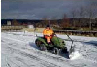
Vorbereitung der Siniwelt für das Eislaufen