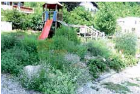
Der „Essbare Spielplatz“ in Übelbach

Aber am 21. November wurde im Rahmen des Grünen Filmfests die Dokumentation „Edible City“ gezeigt. Und was Sandra Peham anschließend vorgetragen hat, wird schon in mehreren Orten der Steiermark in die Tat umgesetzt: Öffentliche Grünflächen werden nicht mehr mit Zierpflanzen bestückt, sondern mit Obststräuchern, Gemüse und Kräutern. Alle interessierten BürgerInnen sind eingeladen, sich an der Pflege zu beteiligen, und wer mag, darf ernten! Kindergärten und Schulen machen mit, Firmen stellen gratis Grundstücke zur Verfügung, Pflanzen und Holz für Hochbeete werden gespendet.