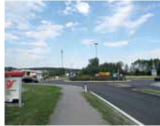
Neuer Asphalt beim Kreisverkehr