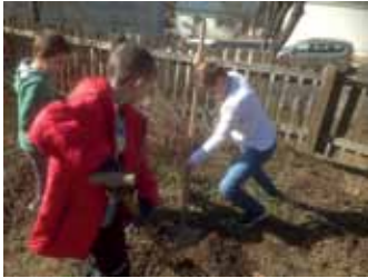
Jahr des Schulgartens und Bienenprojekts