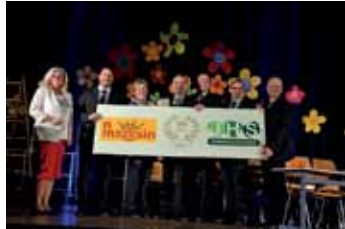
50 Jahre NMS/HS Sinabelkirchen