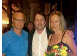
Eröffnung Seerestaurant Sunset in neuem Ambiente