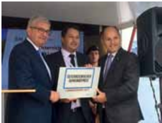
Landessieger Gemeindepreis 2017