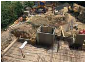
Um- und Zubau Gepflegt Wohnen Sinabelkirchen