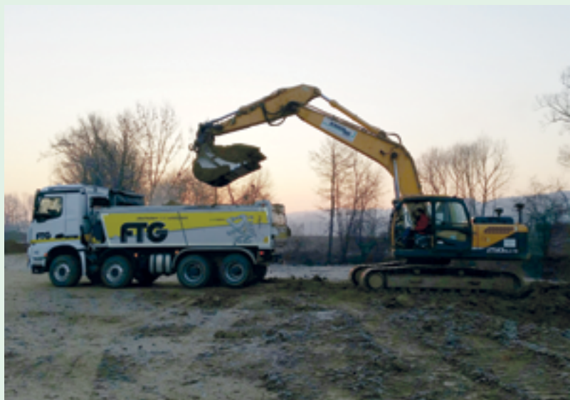
Der Bau des Hochwasserschutzes ist in vollem Gange.