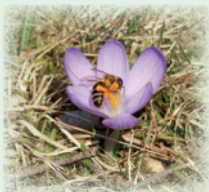
Eine frühe Biene auf einer Krokusblüte leitet den Frühling ein.