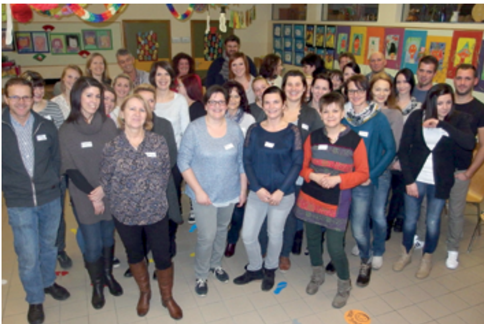
Volksschul-, Kindergarten team und Eltern der Schulanfänger von Sinabelkirchen