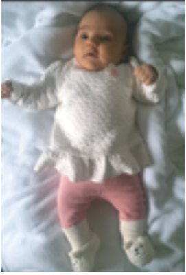
Emely Cerma, Unterrettenbach