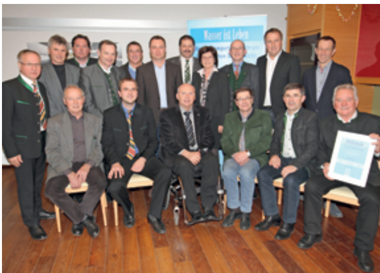
Verbandsführung mit Ehrengästen