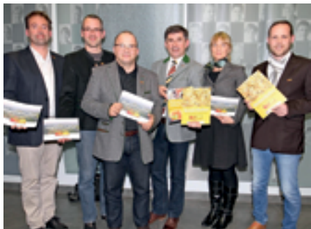
Das Meisterkulturbuch wird heuer neu aufgelegt.