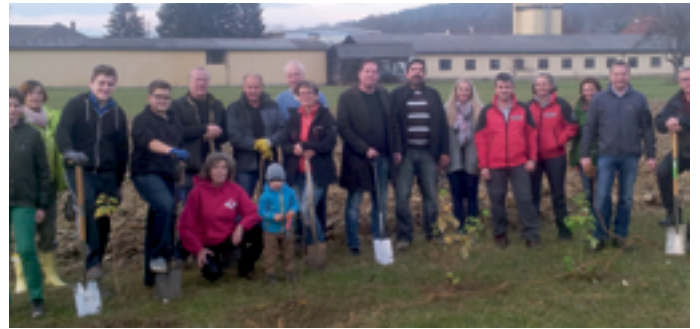
Große und Kleine, Alte und Junge haben bei der ersten gemeinsamen Heckenpflanzung mitgearbeitet.

Wir freuen uns über die Verleihung des Vulkanlandpreises im Bereich „Lebensraum“ – besonders danken wir allen, die uns durch ihre Mitarbeit unterstützt haben und weiterhin unterstützen: die Imkerinnen und Imker, die Jäger, die Berg- und Naturwacht, der Arbeitskreis der Gesunden Gemeinde, die NMS Sinabelkirchen und viele Privatpersonen.