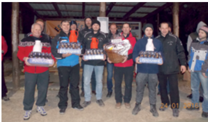
Platz 2: Team ESV Wetzawinkel