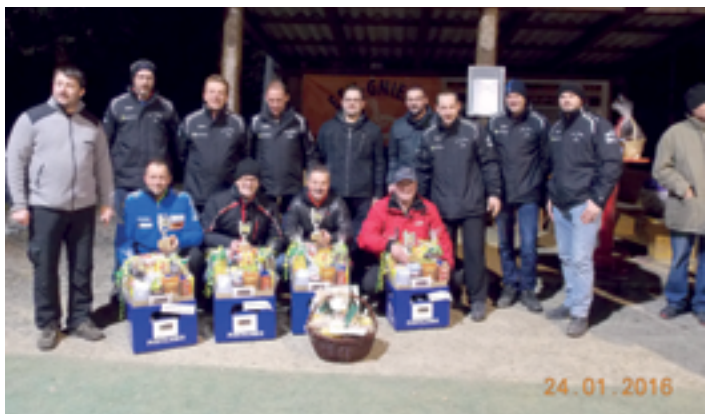
Platz 1: Team Sparkasse

Am Sonntagvormittag, 24. Jänner 2016, gab es das Vorfinale und endlich, am Nachmittag, bei frühlinghaften Temperaturen war es soweit: Das Finale wurde ausgetragen. Fünf Mannschaften haben es geschafft. Das Motto des Turniers lautete: „Jedes Team gegen jedes, und das bessere, nervenstärkere und glücklichere möge gewinnen!“